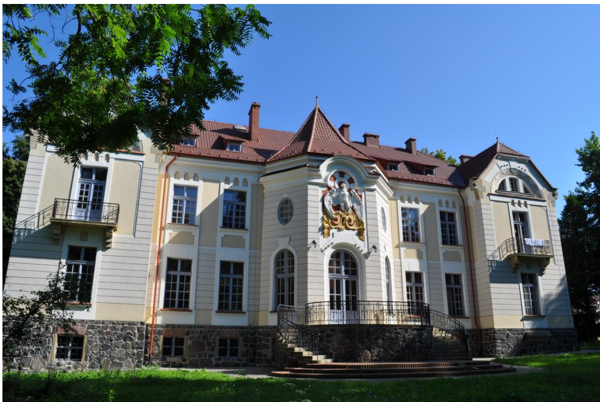
Fotografia 1 Pałac Tyszkiewiczów w Weryni