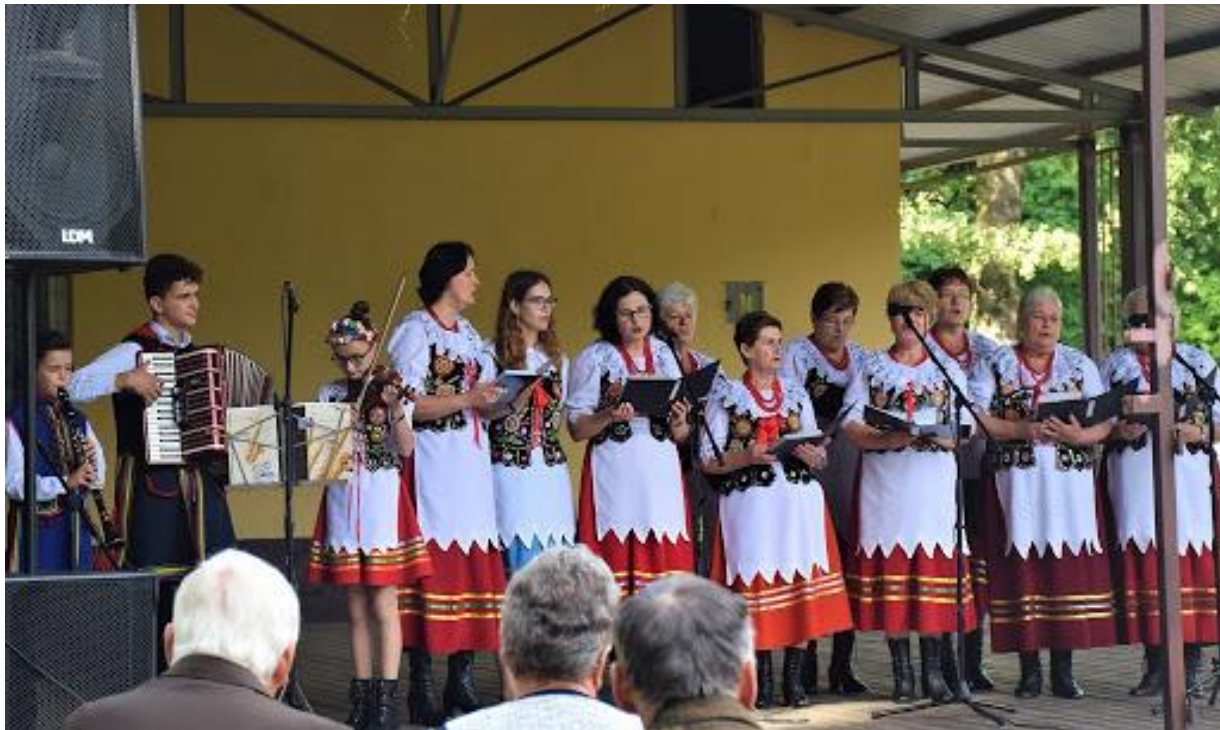
Fotografia 6 Święto Dni Weryni 2019