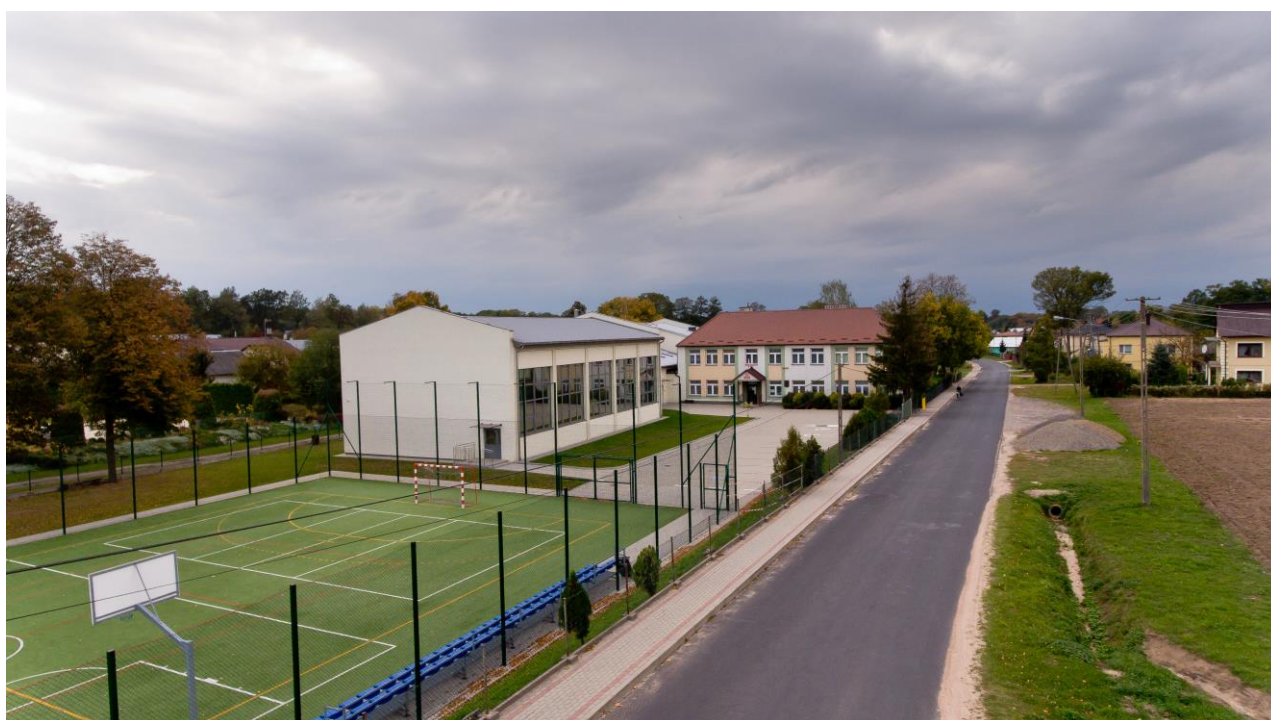
Fotografia 4 Szkoła Podstawowa im. kpt. Józefa Batorego w Weryni