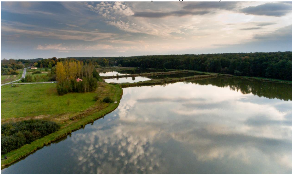
Fotografia 5 Widok na stawy w Weryni