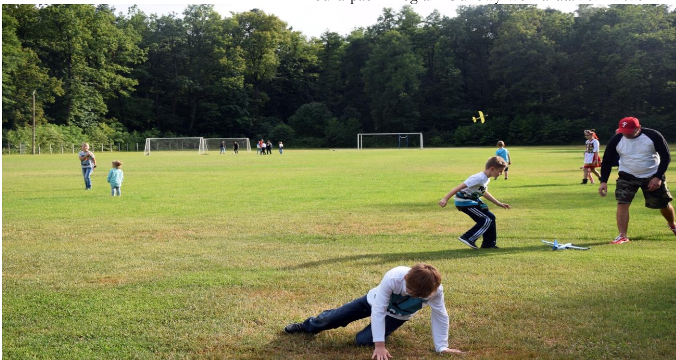
Fotografia 7 Stadion w Weryni