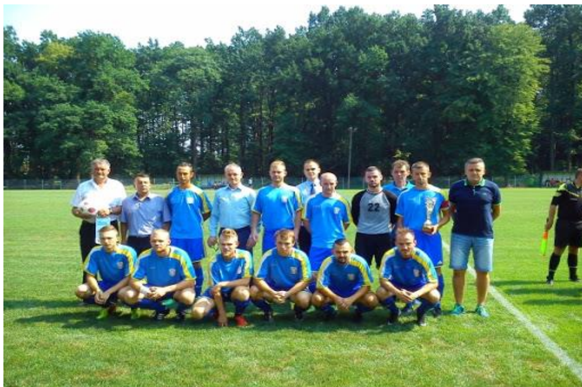
Fotografia 8 Ludowy Klub Sportowy „WERYNIANKA”