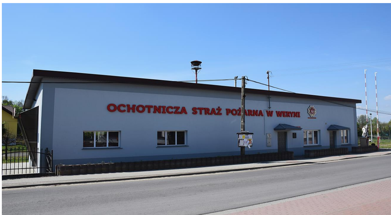
Fotografia 3 Budynek Ochotniczej Straży Pożarnej w Weryni