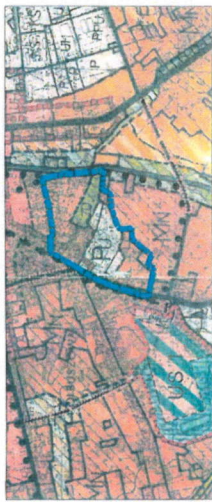
GRANICA TERENU OBJĘTEGO OPRACOWANIEM MPZP

WYRYS ZE STUDIUM UWARUNKWAŃ I KIERUNKÓW ZAGOSPODAROWANIA PRZESTRZENNEGO MIASTA I GMINY KOLBUSZOWA (UCHWAŁA NR XXV/207/2000 RADY MIEJSKIEJ W KOLBUSZOWEJ Z DNIA 28 CZERWCA 2000 ROKU Z PÓŹNIEJSZYMI ZMIANAMI) skala 1:10 000