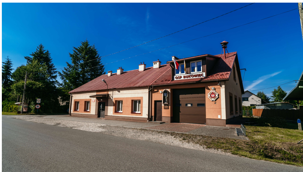
Zdjęcie 3. Budynek wielofunkcyjny, Remiza OSP w Bukowcu