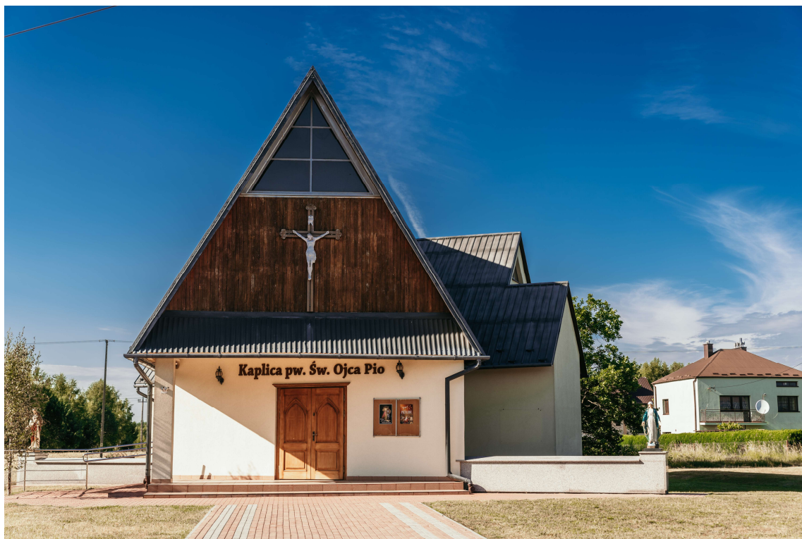
Zdjęcie 2. Kaplica pw. Św. Ojca Pio w Bukowcu