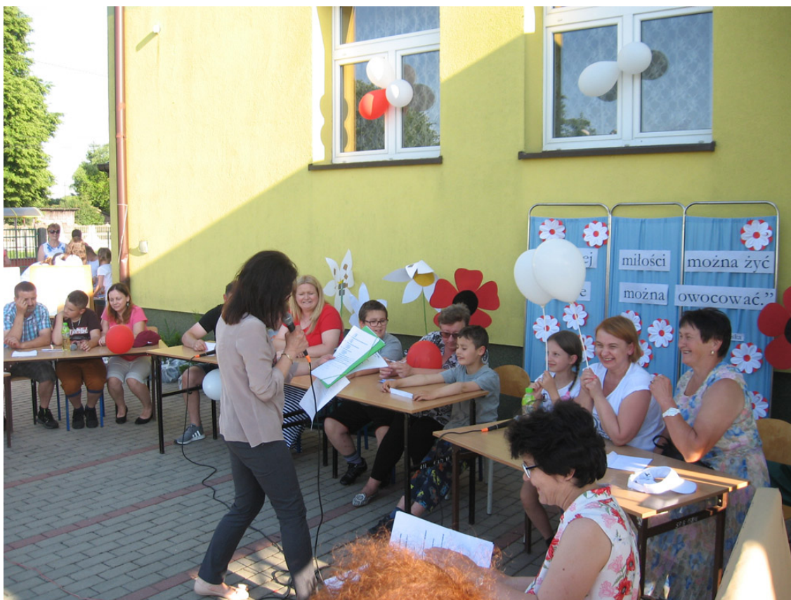
Zdjęcie 5. Piknik Rodzinny w Bukowcu w 2018 roku