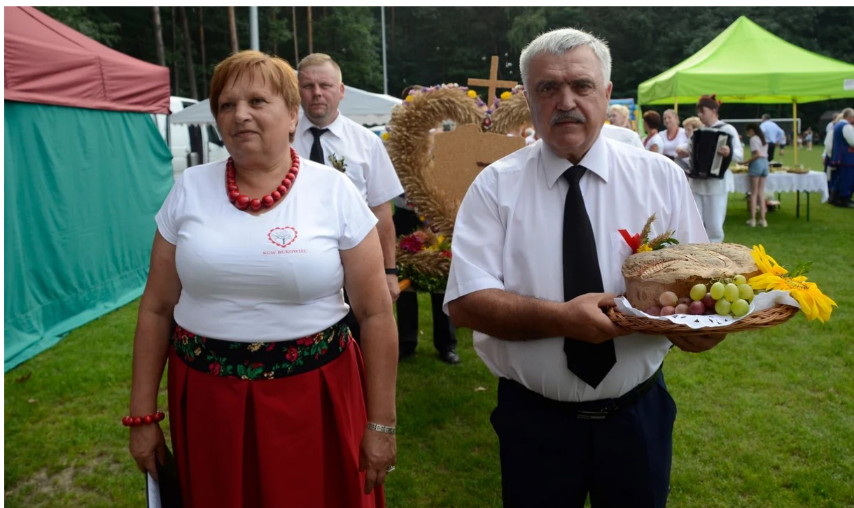
Zdjęcie 6. Zespół wieńcowy z Bukowca, Dożynki Gminne 2023 rok