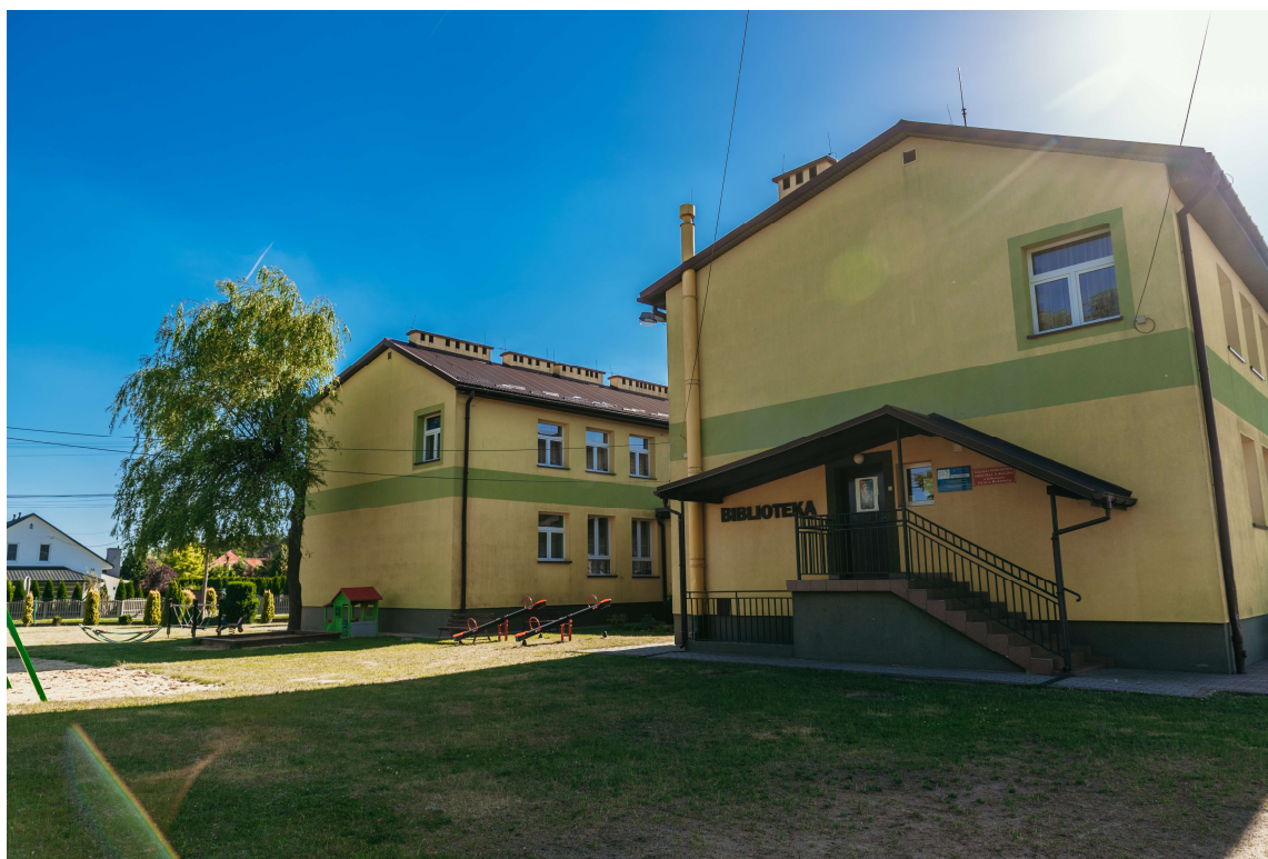
Zdjęcie 1. Szkoła Podstawowa w Bukowcu