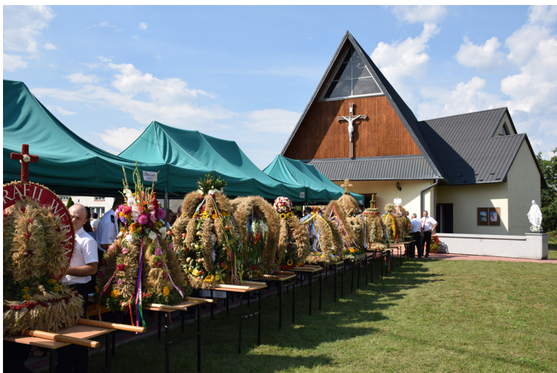
Zdjęcie 8. Dożynki Gminne w Bukowcu w 2018 roku