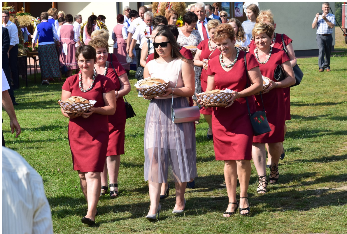
Zdjęcie 5. Koło Gospodyń Wiejskich w Bukowcu