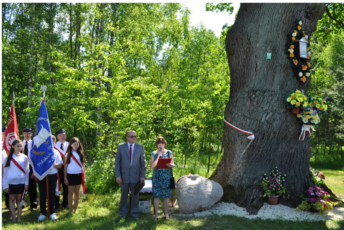
Zdjęcie 12. Ceremonia nadania imienia dla Dębu „Bednorz” – Pomnik Przyrody