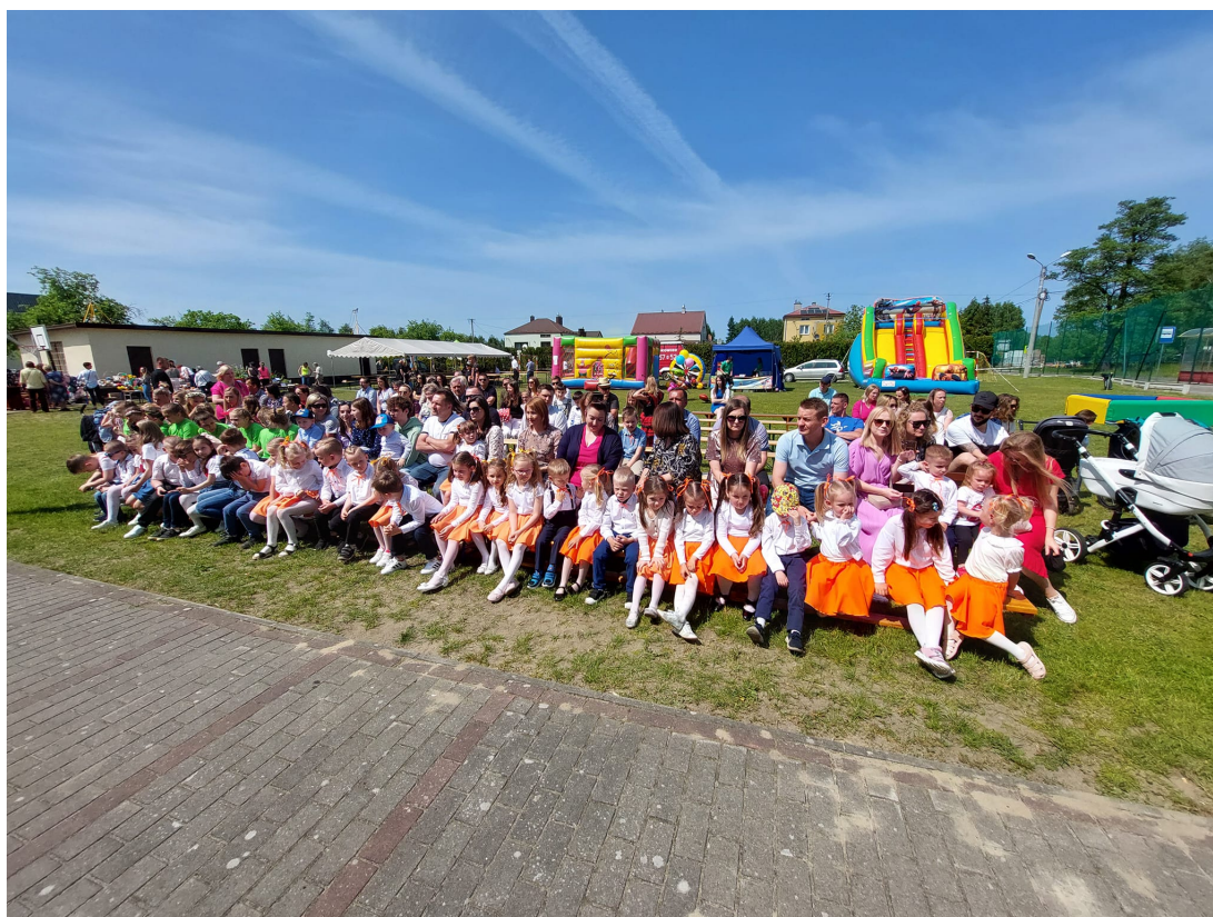
Zdjęcie 6. Piknik Charytatywny w Bukowcu w 2023 roku