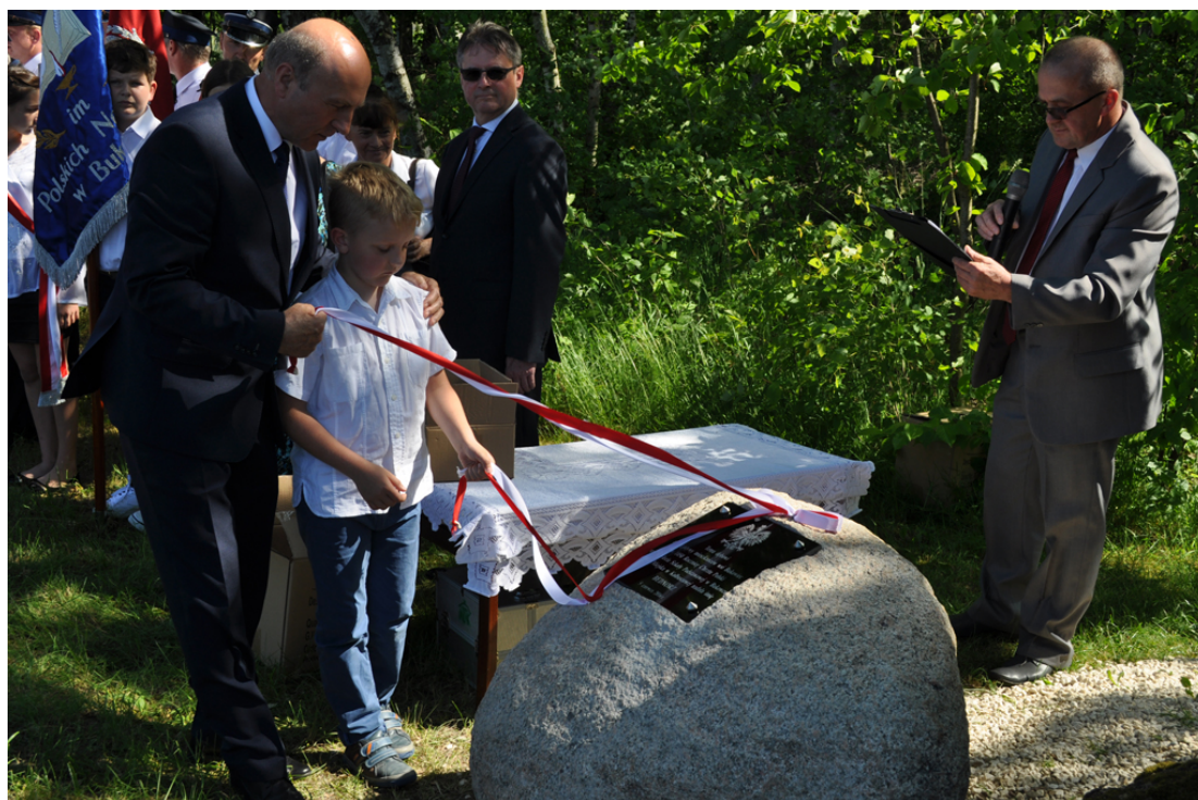
Zdjęcie 11. Ceremonia nadania imienia dla Dębu „Bednorz” – umieszczenie pamiątkowej tablicy wraz z kapsułą czasu