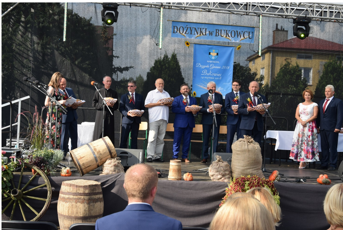
Zdjęcie 7. Dożynki Gminne w Bukowcu w 2018 roku