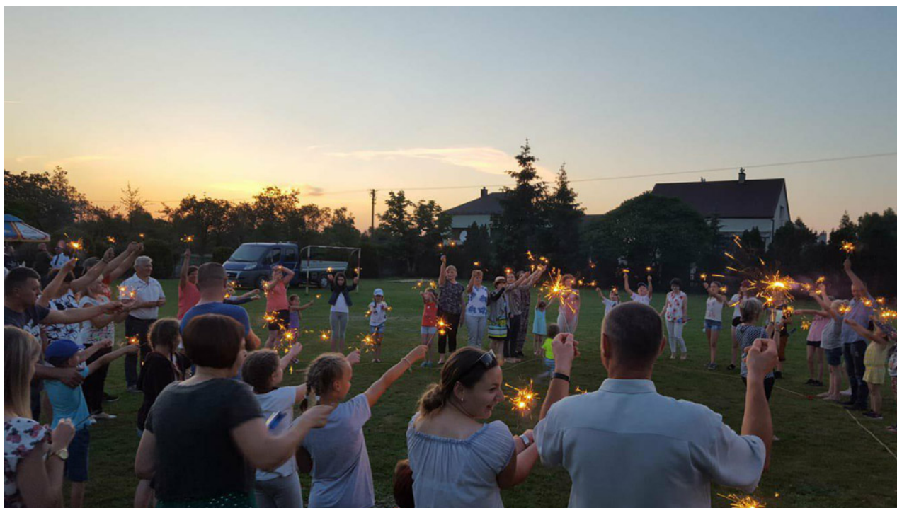
Zdjęcie 6. Piknik Rodzinny w Bukowcu w 2018 roku