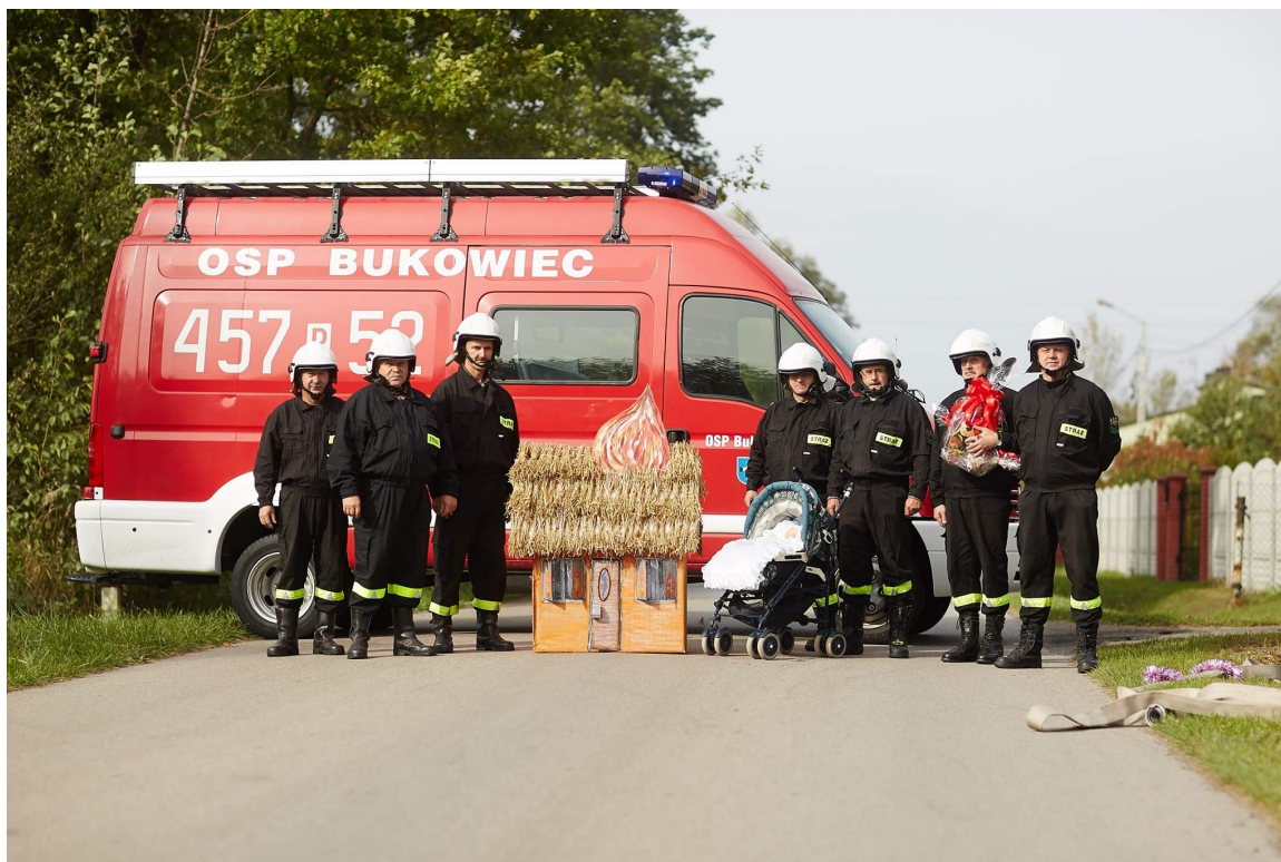
Zdjęcie 4. Strażacy z Ochotniczej Straży Pożarnej w Bukowcu