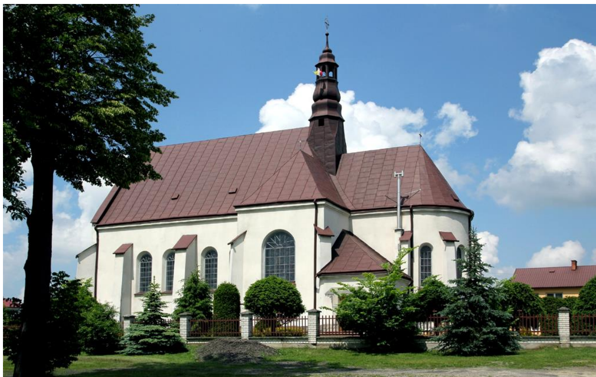
Fofografia 3 Kościół parafialny w Widelce