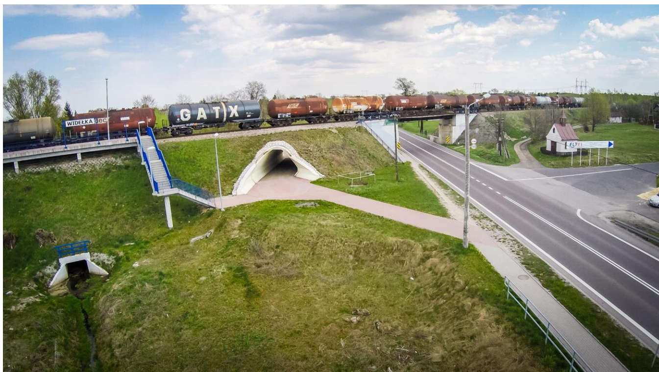
Fofografia 2 Stacja kolejowa oraz tory kolejowe nad Droga krajową w Widelce.