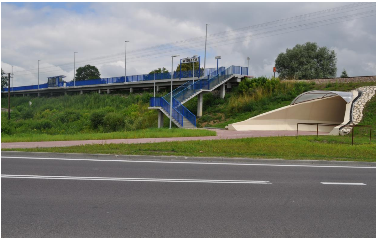
Fofografia 1 Stacja kolejowa w Widelce wraz z infrastrukturą.