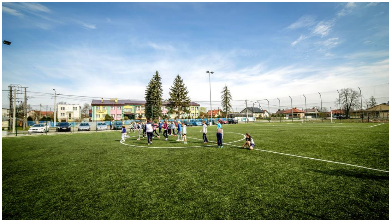
Fofografia 13 Rozgrywki na Orliku w Widelce