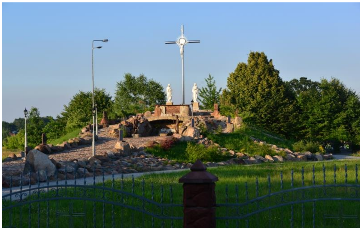
Fofografia 5 Golgota przy Cmentarzu Parafialnym w Widelce.