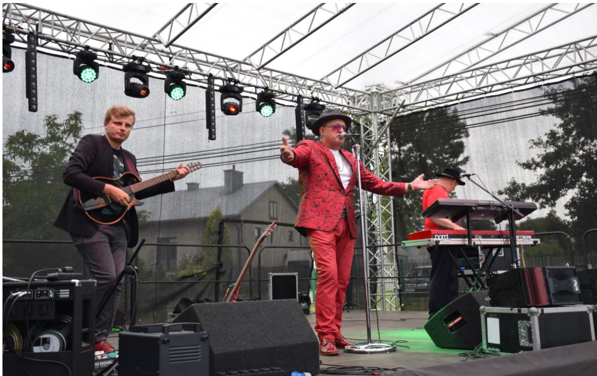
Fofografia 9 "Biesiada u Widelan" - impreza zorganizowana we miejscowości Widelka dnia 15 lipca 2018 r.