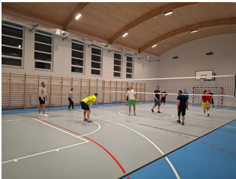
Zdjęcie 18. Wycieczka integracyjna dla mieszkańców Przedborza