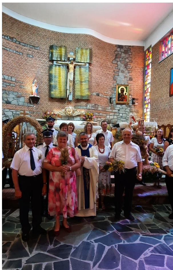
Zdjęcie 10. Koło Gospodyń Wiejskich w Przedborzu Współpraca z Muzeum Kultury Ludowej w Kolbuszowej