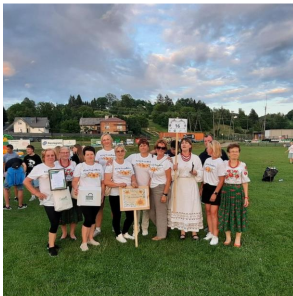
Zdjęcie 6. Koło Gospodyń Wiejskich w Przedborzu Festiwal Kwiatów w Albigowej