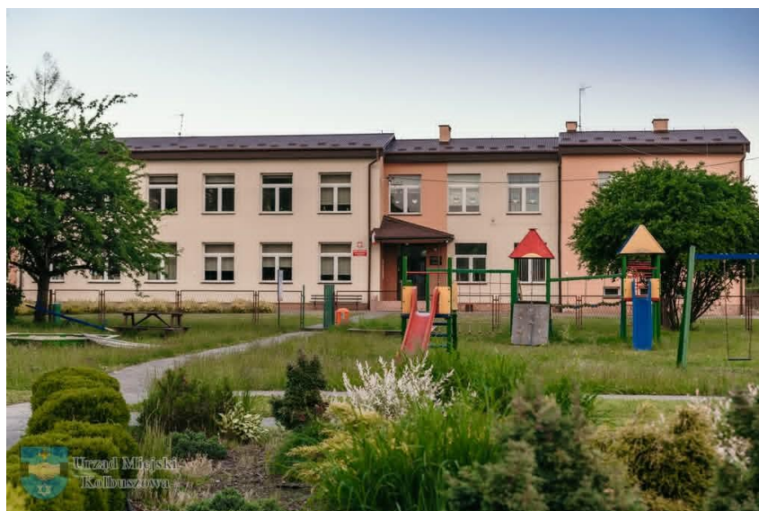
Zdjęcie 1. Szkoła Podstawowa im. Janka Zawiszy w Przedborzu