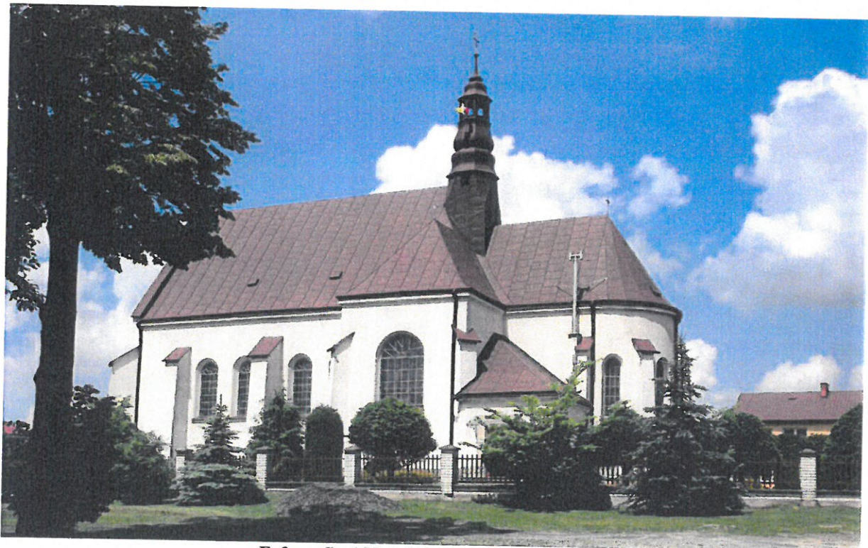
Fofografia 4 Kościół parafialny w Widelce