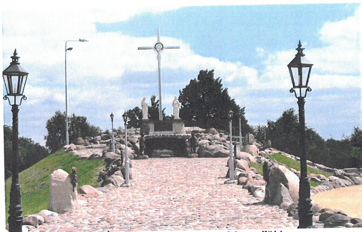
Fofografia 5 Golgota przy Cmentarzu parafialnym w Widelce.