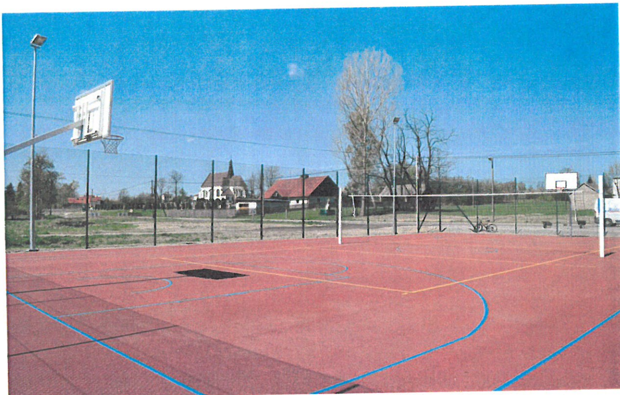
Fotografia 13 Boisko Orlik w Widelce.