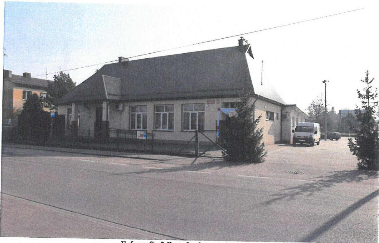
Fofografia 3 Dom Ludowy w Widelce.