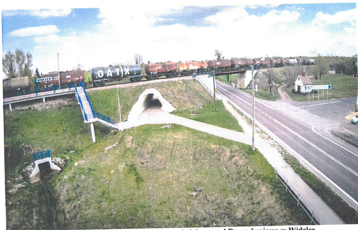
Fofografia 2 Stacja kolejowa oraz tory kolejowe nad Droga krajową w Widelce.