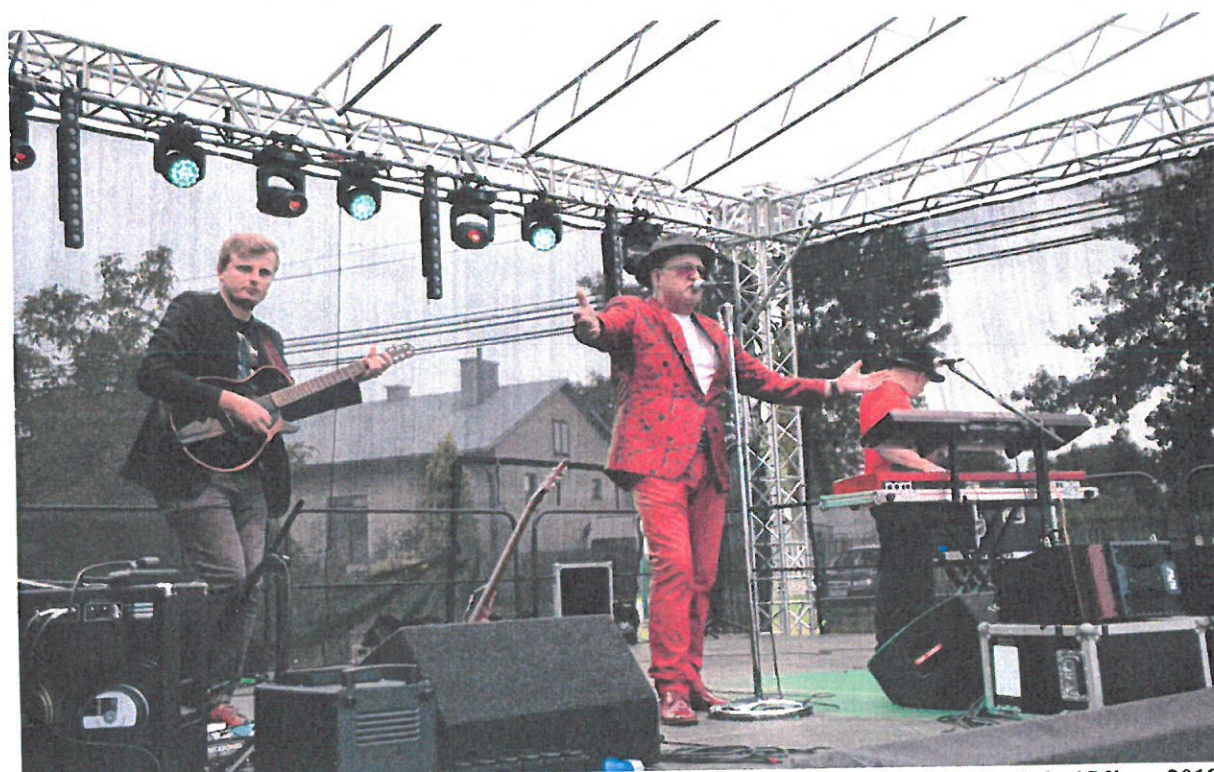
Fofografia 10 „Biesiada u Widelan” - impreza zorganizowana we miejscowości Widelka dnia 15 lipca 2018 r.