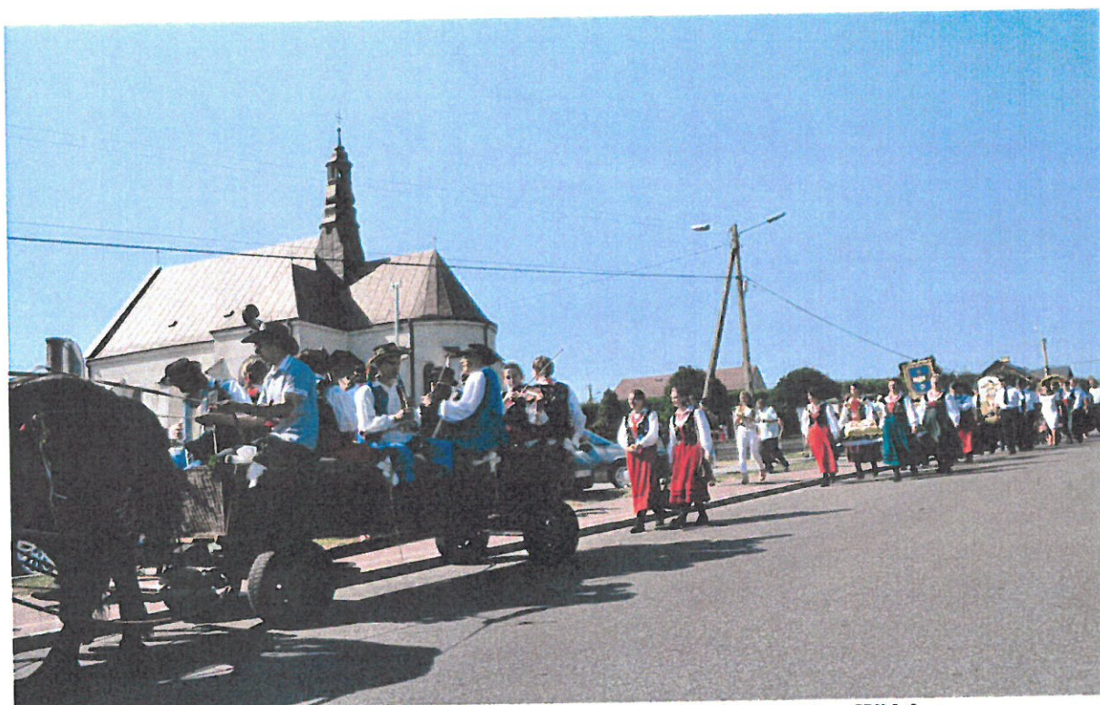
Fofografia 9 Kapela „Widelanie” podczas Dożynek Gminnych w Widelce.