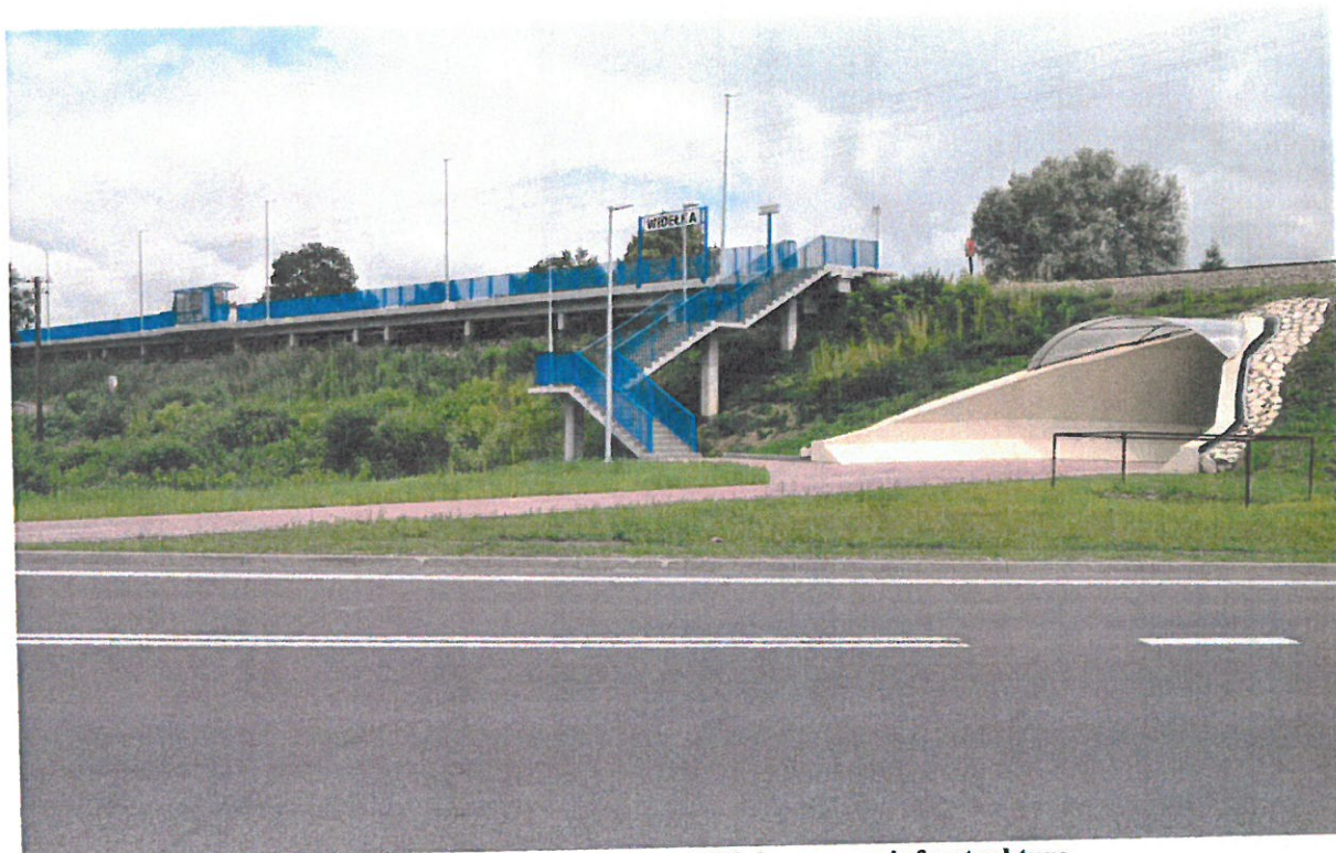
Fofografia 1 Stacja kolejowa w Widelce wraz z infrastrukturą.