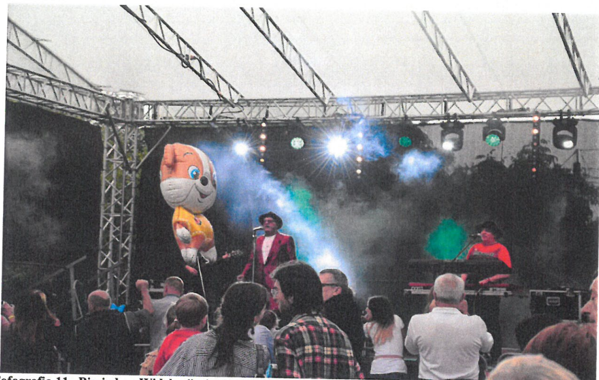
Fofografia 11 „Biesiada u Widelan” - impreza zorganizowana we miejscowości Widelka dnia 15 lipca 2018 r.