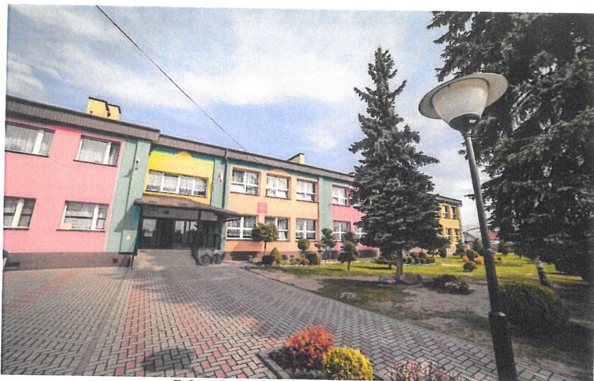
Fofografia 7 Szkoła Podstawowa w Widelce.