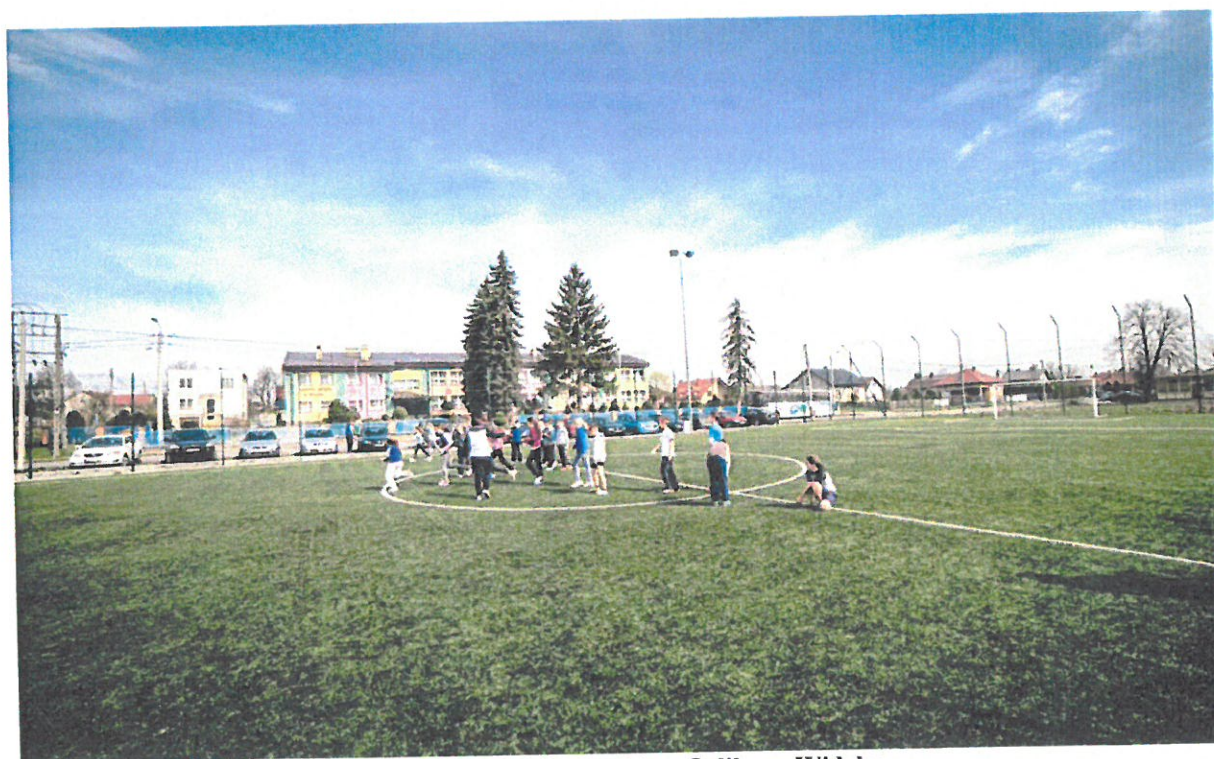
Fotografia 14 Rozgrywki na Orliku w Widelce