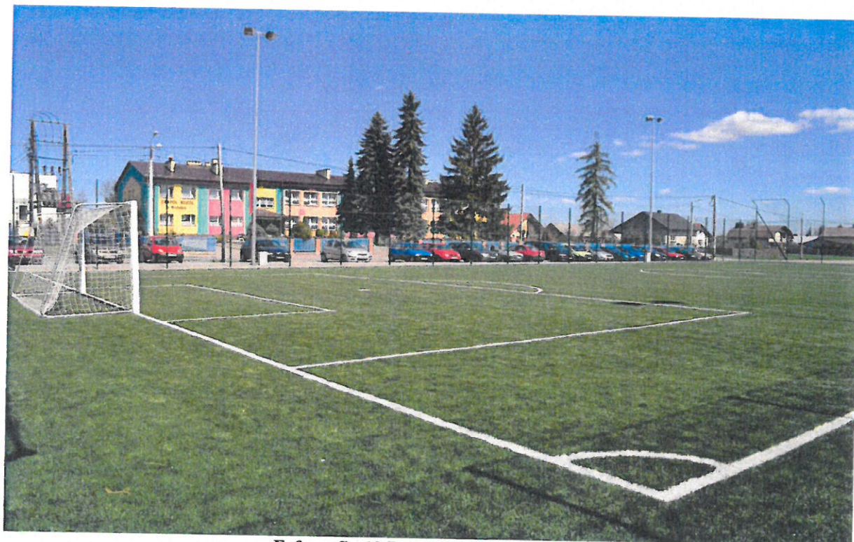
Fofografia 12 Boisko Orlik w Widelce.