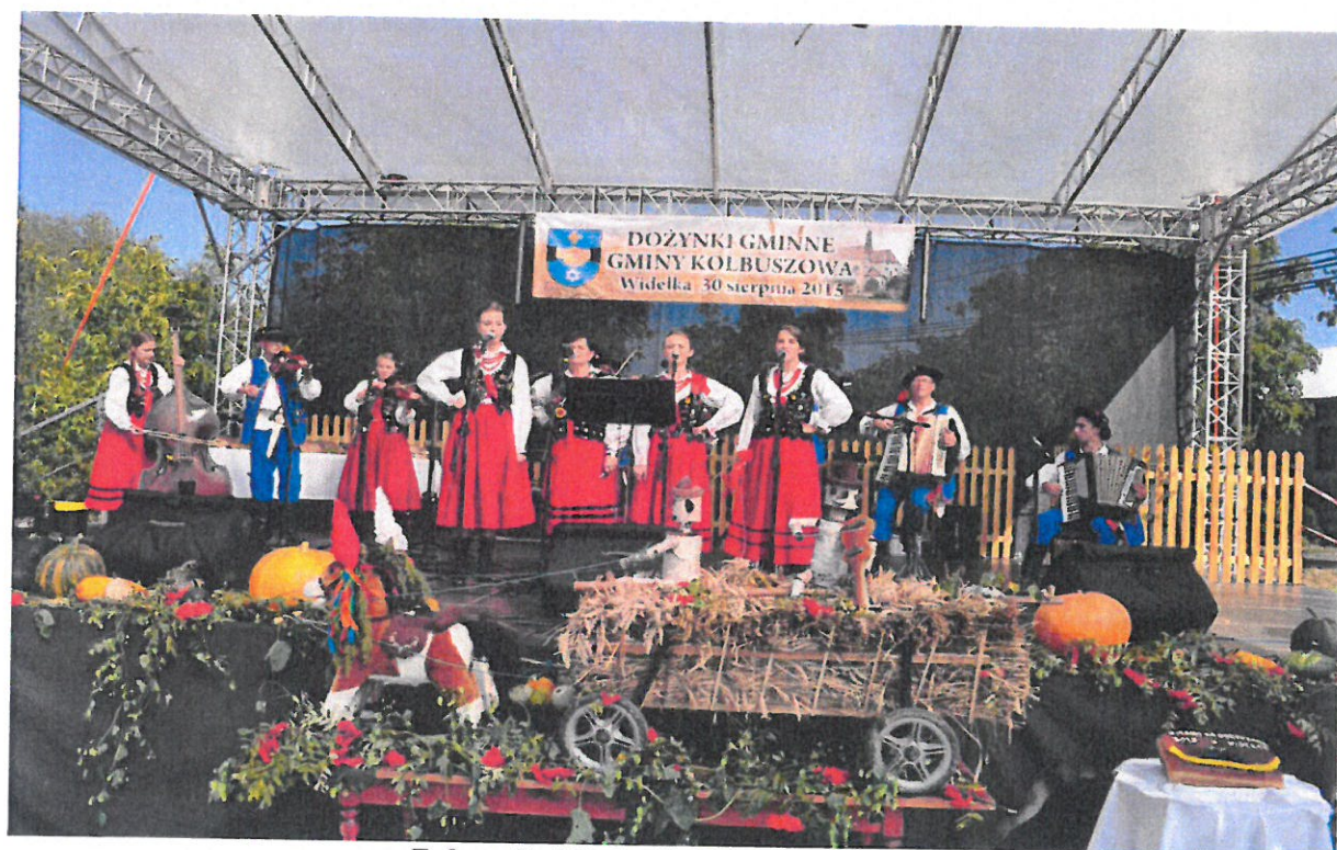
Fofografia 8 Dożynki Gminne w Widelce.