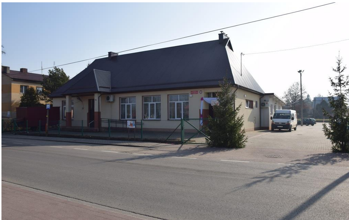
Fofografia 3 Dom Ludowy w Widelce.