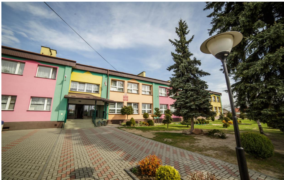
Fotografia 7 Szkoła Podstawowa w Widelce.