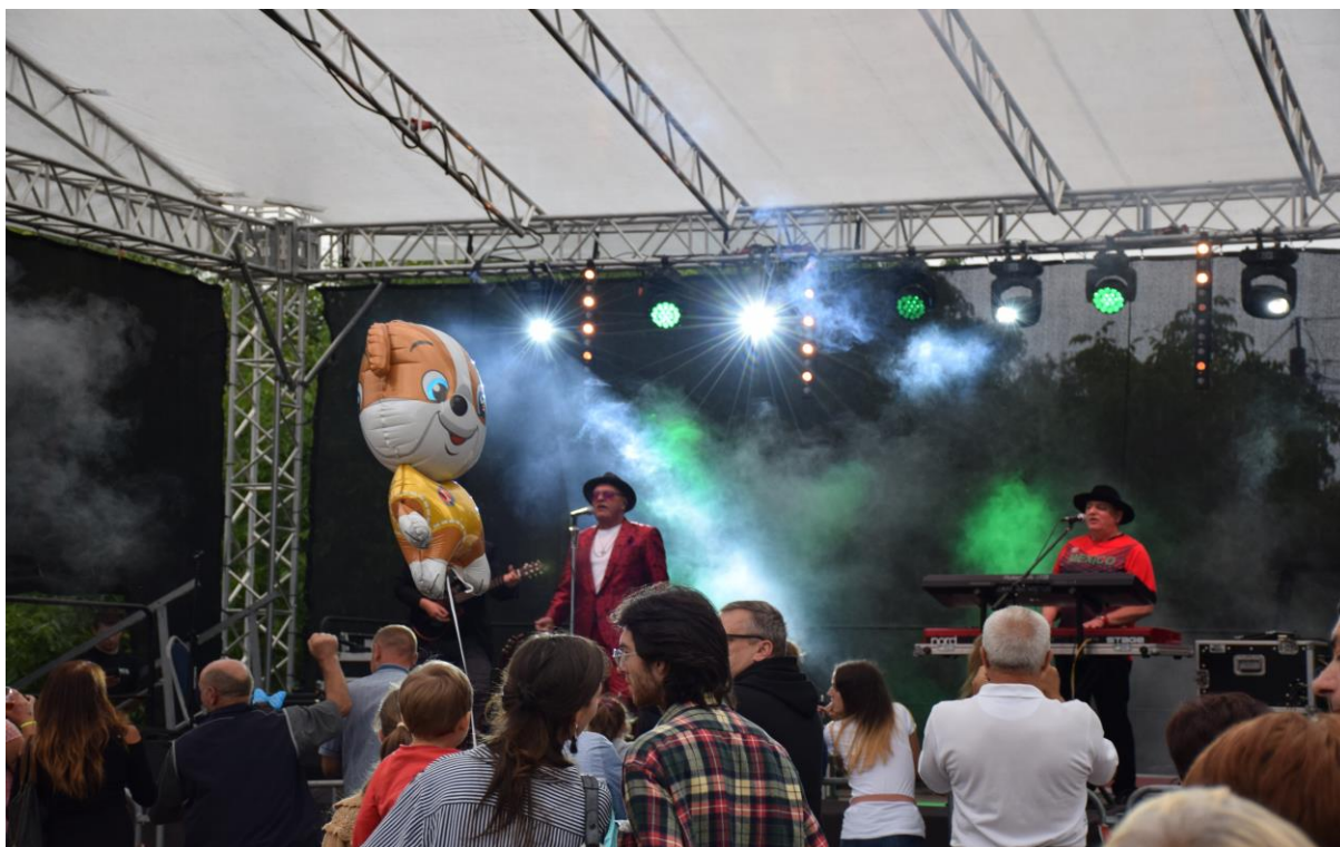
Fofografia 11 „Biesiada u Widelan” - impreza zorganizowana we miejscowości Widelka dnia 15 lipca 2018 r.