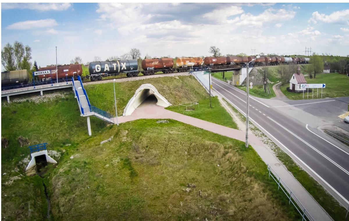
Fofografia 2 Stacja kolejowa oraz tory kolejowe nad Droga krajową w Widelce.