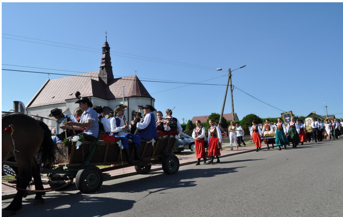
Fofografia 9 Kapela „Widelanie” podczas Dożynek Gminnych w Widelce.