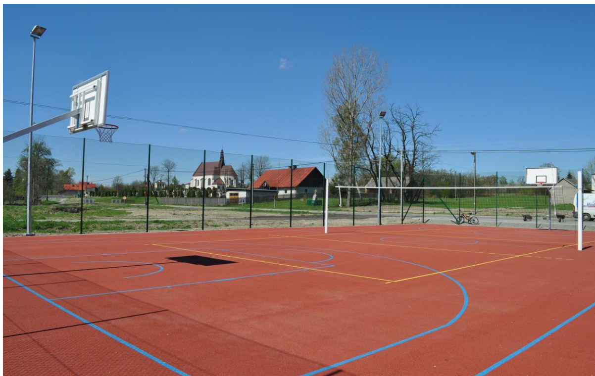
Fofografia 13 Boisko Orlik w Widelce.