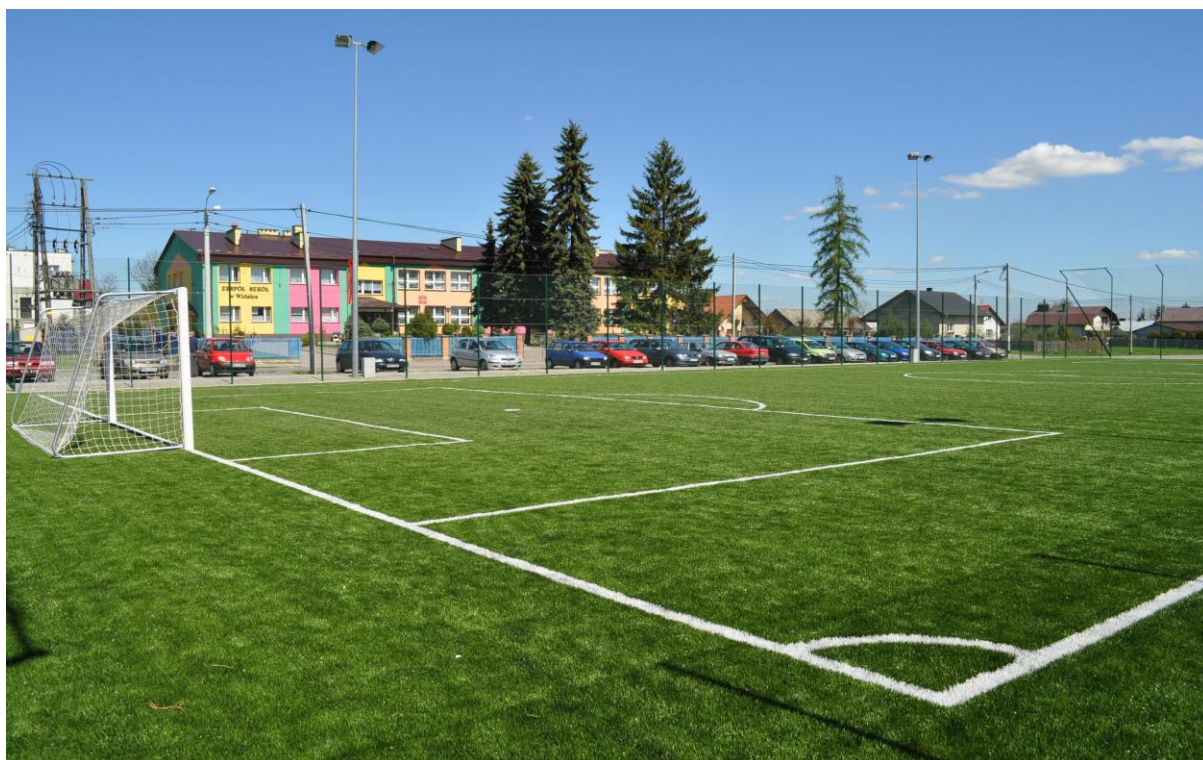
Fofografia 12 Boisko Orlik w Widelce.