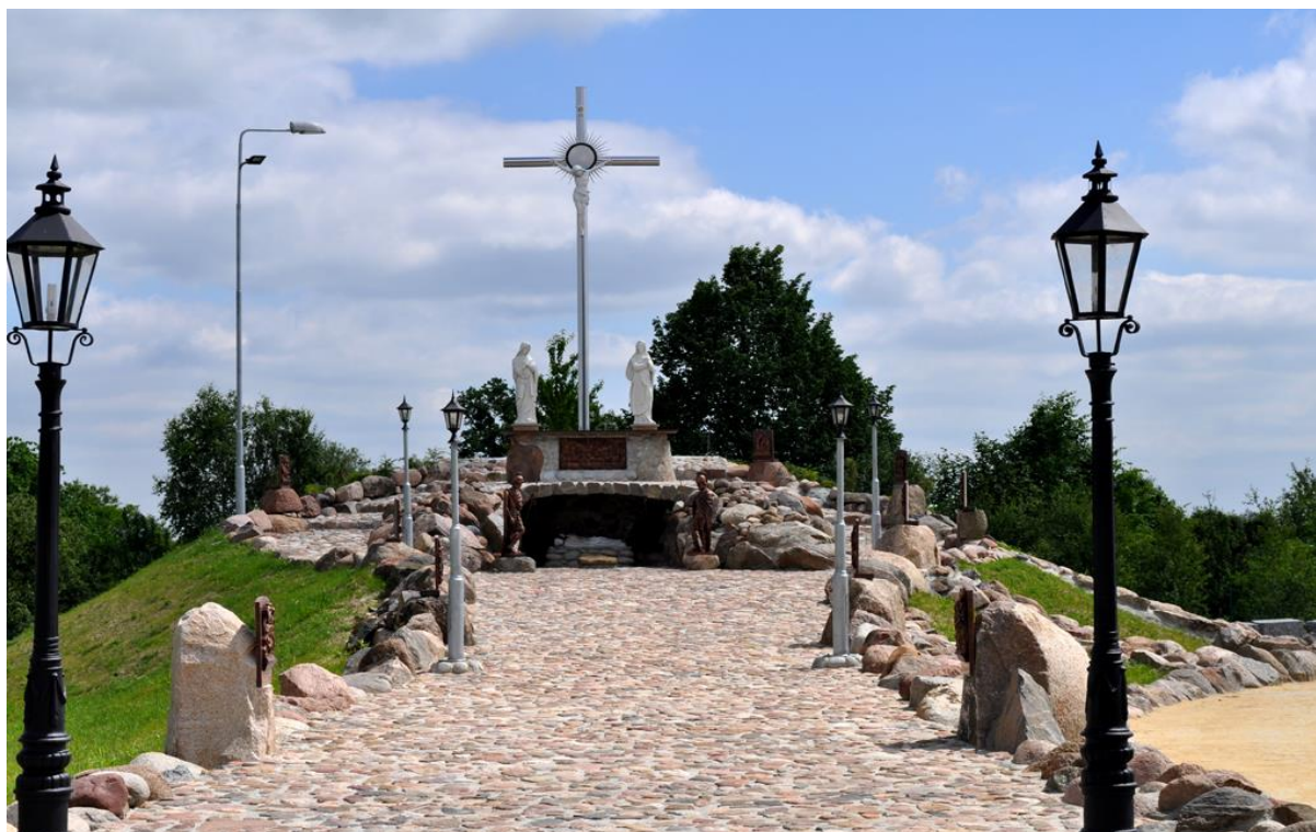
Fofografia 5 Golgota przy Cmentarzu parafialnym w Widelce.