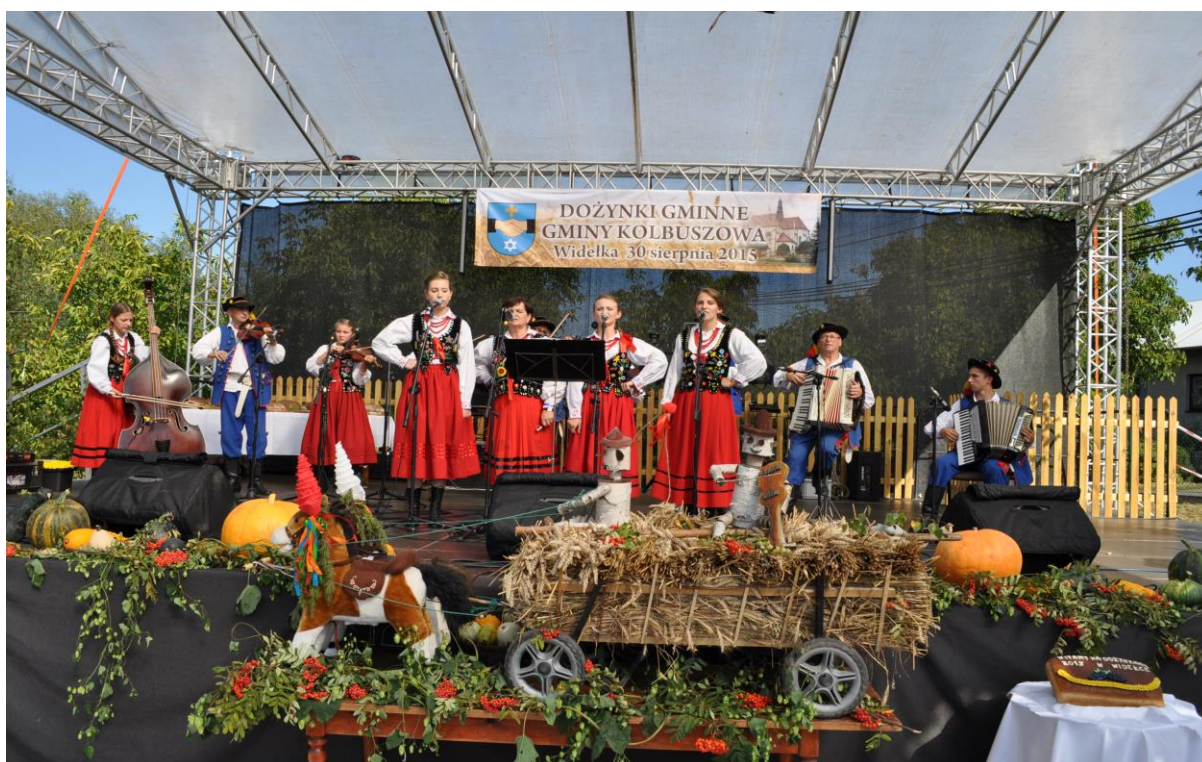
Fotografia 8 Dożynki Gminne w Widelce.